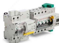
TeleREC 2 - TeleREC Top Automatisches Wiedereinschaltssystem