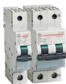
Fixwell* - Stecksystem ohne Schrauben LS- und FI-Schutzschalter