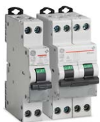
ElfaPlus Unibis* Kompakter LS-Schalter