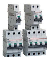
Leitungsschutzschalter mit UL Approbation