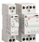
Contax R Installationsrelais