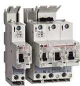
Serie S90 Leitungsschutzschalter