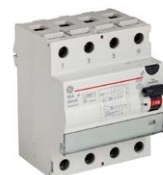
Allstromsensitiv Typ B und Typ F FI-Schutzschalter