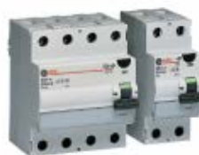
Serie FP FI-Schutzschalter