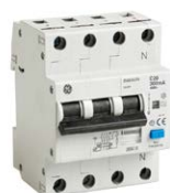
Serie DMA63N 3P+N, 3 polige LSF (RCBO) FI-Schutzschalter mit Überstromauslöser