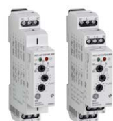
Pulsar T+ Zeitrelais