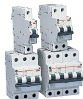
EP100 10kA Leitungsschutzschalter