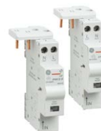
Serie AF Fehlerlichtbogen- Schutzeinrichtung