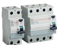
Serie FPAUL FI-Schutzschalter mit UL Approbation