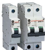
EP100/104UC DC Leitungsschutzschalter