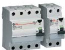
Serie FI FI-Schutzschalter