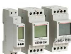
Galax Plus Digitale Schaltuhren