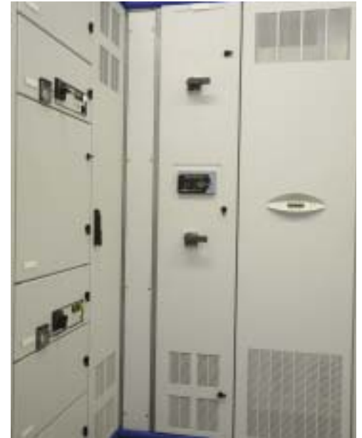
Le module onduleur peut être entièrement intégré au tableau, garantissant la sécurité du personnel et un MTTR réduit.

Cette phase concerne la construction individuelle de chaque système, type "ensemble de série" conformément à la norme EN/CEI 60439-1, suivie d'une rigoureuse procédure de test en conditions réelles. SE Digital Power est un TGBT complet comprenant des éléments remplaçables à chaud dans les meilleures conditions de sécurité pour l'opérateur, ainsi que des modules d'onduleurs redondants intégrés sans point unique de faiblesse, et bénéficie d'une protection EMI Classe A pour l'intégralité de l'installation. Les jeux de barres horizontaux, supportant jusqu'à 4000 A avec une résistance aux courts-circuits de 80 kA/ 1 sec, et une capacité totale des onduleurs allant jusqu'à 4000 kVA, permettent de concevoir des réseaux électriques fiables pour une large gamme d'applications. Des options telles que la détection précoce des fumées et un dispositif de mesure de la qualité de l'alimentation sont associées à un système de surveillance et de diagnostic hors du commun. Ainsi SE Digital Power représente une solution d'alimentation électrique à la fiabilité optimale pour les applications critiques.