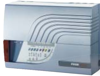
Le système laser de détection précoce des fumées présente une sensibilité de 0,005%/m et surveille tous les compartiments de l'installation.

Une interface MMI conviviale permet d'intégrer facilement de multiples sources de signaux et de données au système de surveillance et de diagnostic à distance.